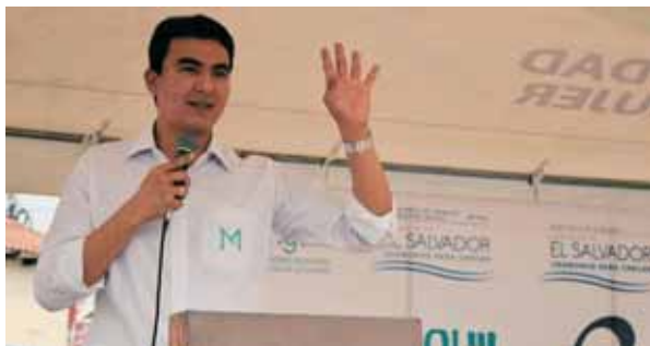
Miguel Pereira, alcalde de San Miguel